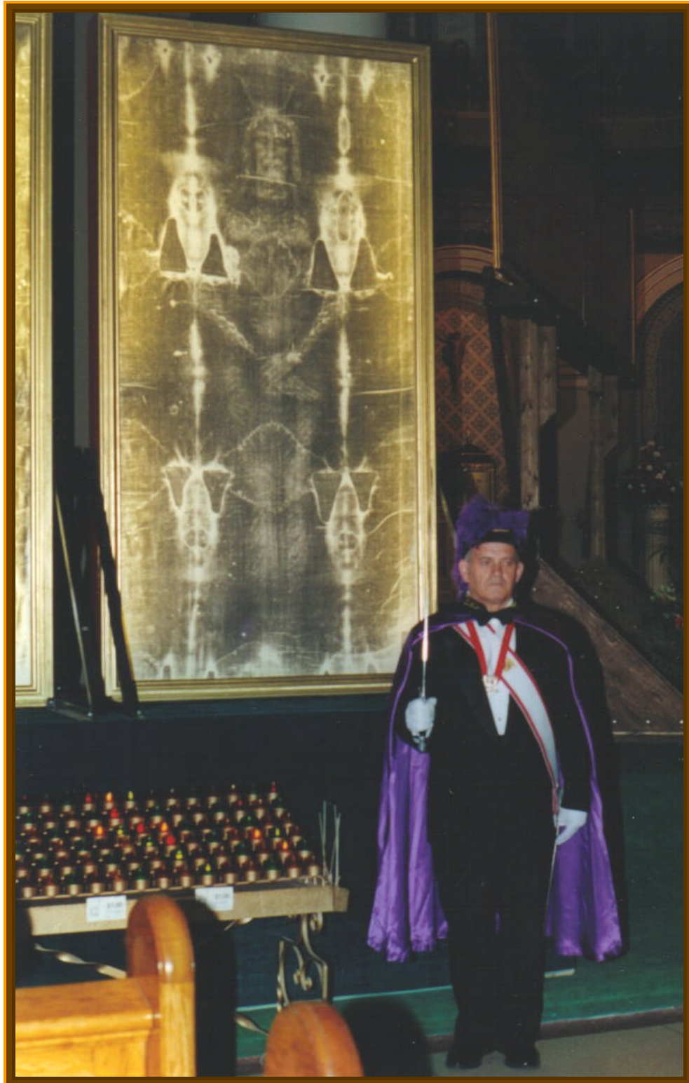
Guardia d'Onore nella Saint Paul's Basilica di Toronto

lettera dall'organizzazione The Holy Face Association che non soltanto ci ha fatto un dettagliato reso conto dell'enorme successo della mostra ma ci ha inviato diverse, bellissime fotografie. Davanti all'immagine a grandezza naturale della sacra Sindone si alternavano le diverse guardie d'onore con le loro uniformi da grande festa.