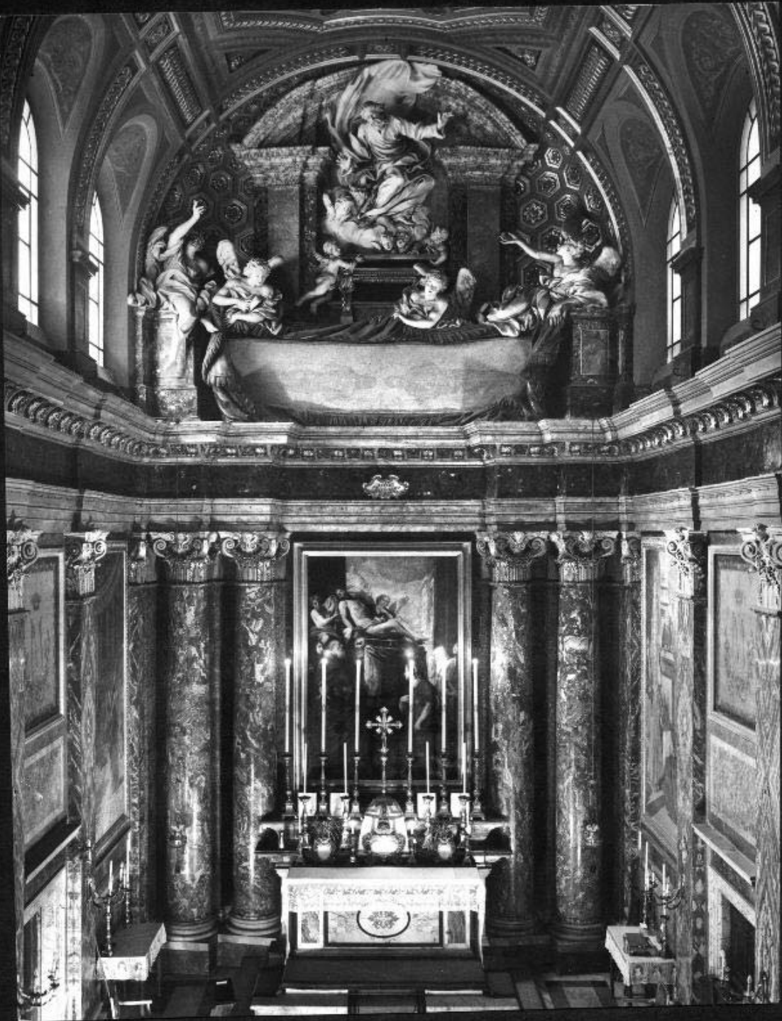
ROMA, CHIESA SANTO SUDARIO (ITALIA)